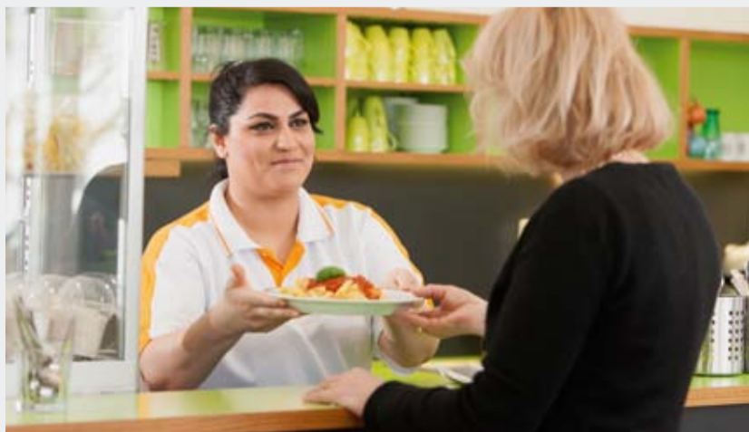
Gewohnte Qualität gibt es in der Kantine der Dachauer Straße.