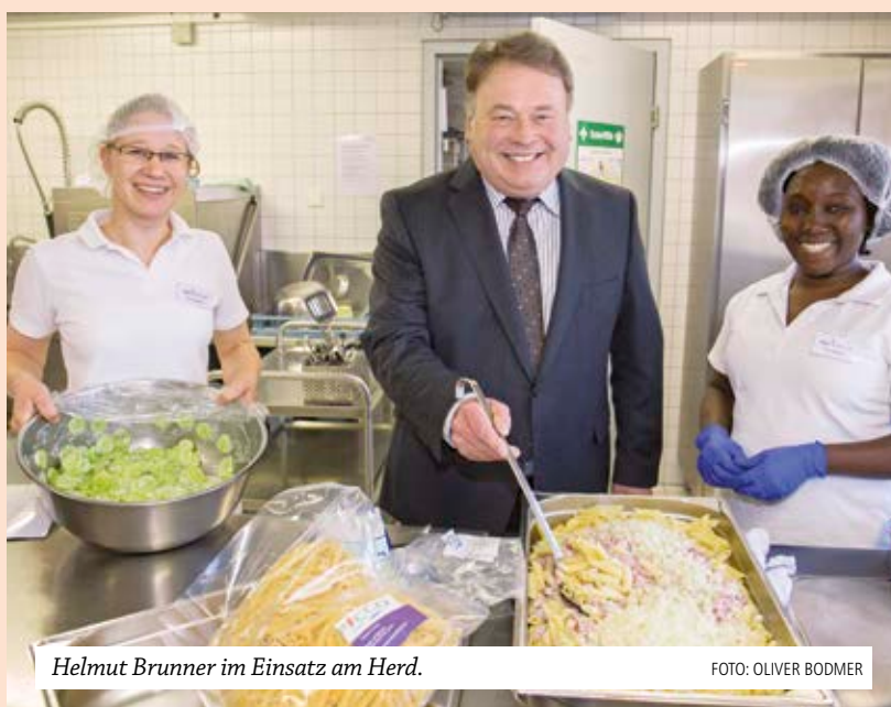
Helmut Brunner im Einsatz am Herd.