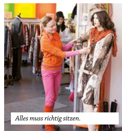
Alles muss richtig sitzen.