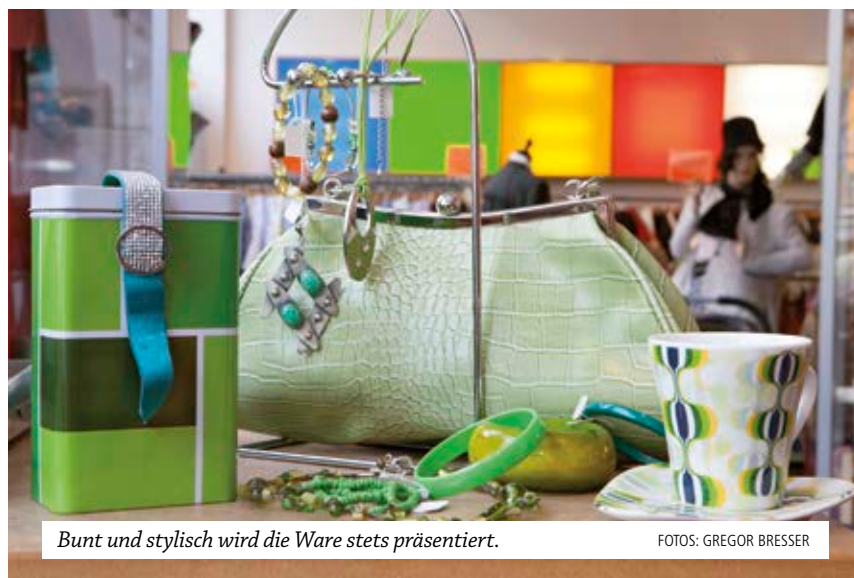
Bunt und stylisch wird die Ware stets präsentiert.

A n grauen, trüben Tagen wirkt ein Besuch im stoffwechsel in der Donnersbergerstraße wie eine Farbtherapie: Rot, Grün, Gelb, Blau – aus jeder Ecke strahlt eine andere Farbe heraus, die bunten Akzente an den Wänden verstärken diesen Effekt. Es besteht kein Zweifel: Einen Secondhand-Laden wie diesen gibt es nur einmal. Das haben auch schon andere bemerkt. Für den letzten Weihnachtstatort wurde im stoffwechsel gedreht. Perfekt in Szene gesetzt präsentierte sich der diakonia-Laden den Zuschauern in ganz Deutschland. Und auch heuer gibt es Grund zum Feiern: Seit zehn Jahren gibt es den Gute-Laune-Laden, der sich im Lauf der Zeit einen treuen Kundestamm erarbeitet hat. Viele junge Leute gehen hier ein und aus. Auf der Suche nach knalligen Modeteilen oder nach aus-